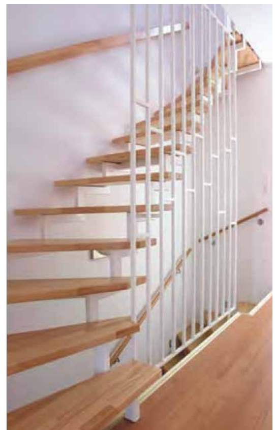
(Beispielbilder zeigen mögliche Sonderausstattungen)