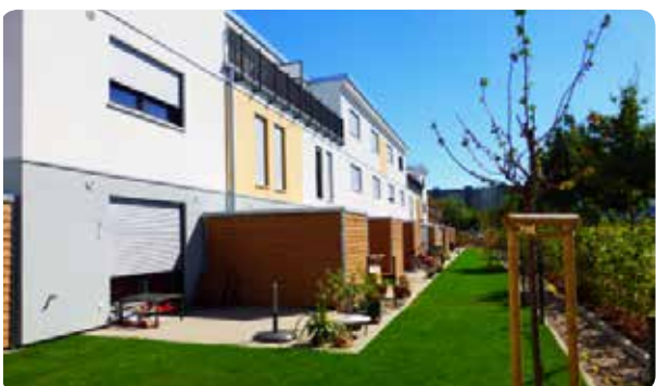
Darmstadt - Kranichstein 54 Wohneinheiten, fertiggestellt 2012/2013