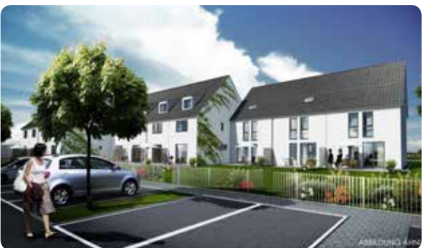
Frankfurt - Harheim 11 Wohneinheiten, fertiggestellt 2013