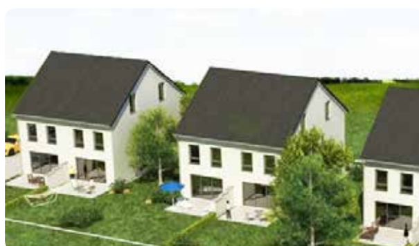
Hattersheim-Eddersheim 6 Wohneinheiten, zuerzeit im Bau